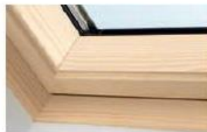
Holz klar lackiert