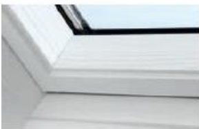
Holz weiß lackiert